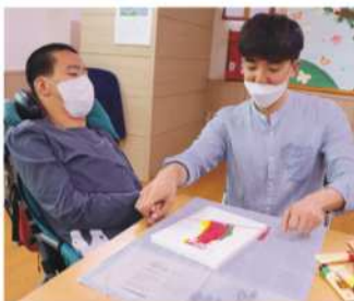
미술 - 실그림 그리기