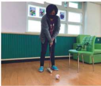
스포츠 - 게이트볼