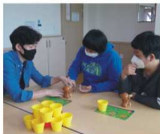
보드게임 - 코코너츠