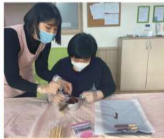
요리 - 뽕뽕로 만들기