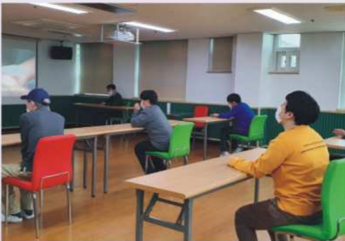
예방 시청각 교육