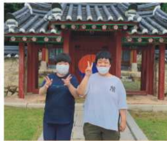
야외활동 - 반구정