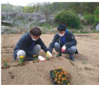
원예 - 꽃 모종 심기