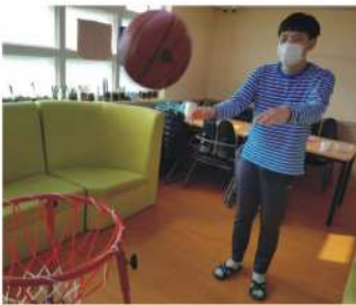
스포츠 - 농구