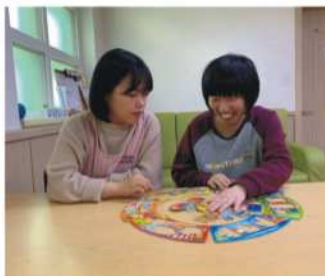
보드게임 - 정리정돈 게임