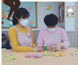
미술 - 봄꽃리스 만들기