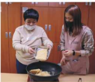
요리 - 스파게티 만들기