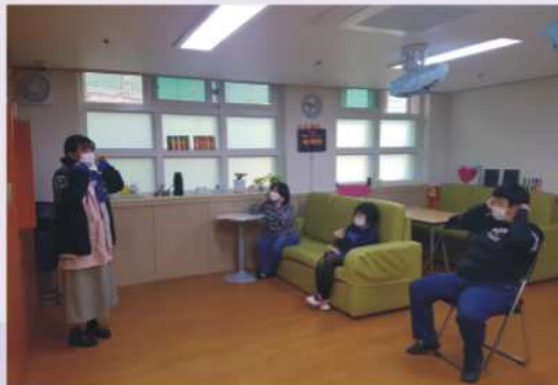
마스크 착용 교육