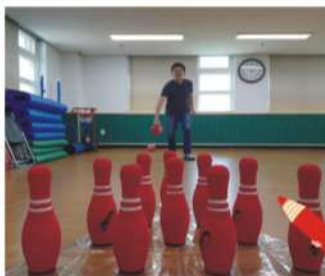
스포츠 - 볼링