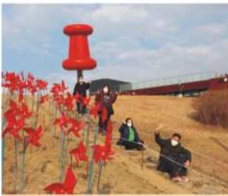
야외활동 - 임진각