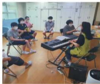
음악 - 노래 부르기