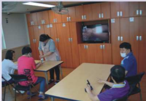
손 소독 교육