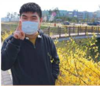
야외활동 - 안곡습지공원